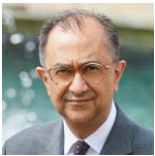
Bankim Thanki QC See more