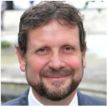
Charles Béar QC See more