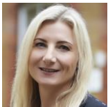
Anneliese Day QC See more