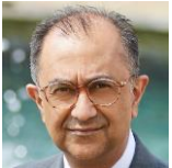
Bankim Thanki QC See more