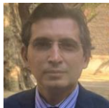
Zal Andhyarujina SA