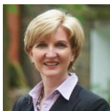
Leigh-Ann Mulcahy QC See more